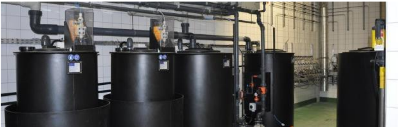
Purificação do ar por lavadores de gases e filtros de carvão ativados.