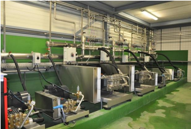
Bombas de alta pressão 100 – 200 bar