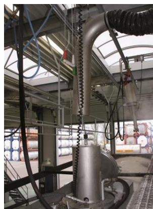
Limpeza à 200 bar