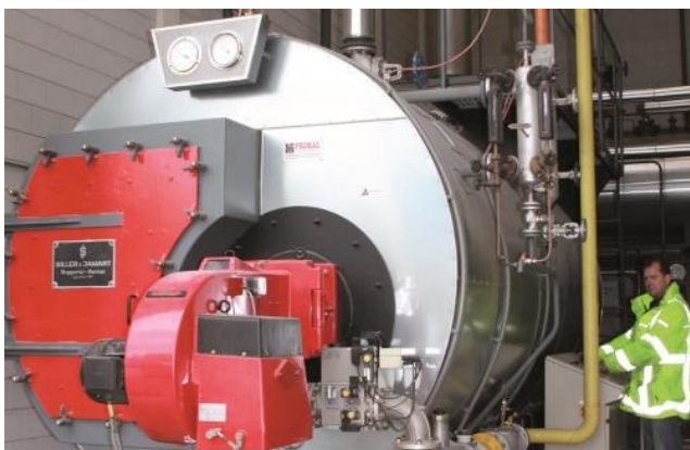
Caldeira à vapor